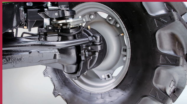
Elektronisch zuschaltbarer Allradantrieb und 100% Differentialsperre, 4-Radbremse und 55° Lenkeinschlagwinkel.