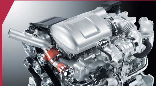
FARMotion Motoren mit elektronischer 2.000 bar Common- Rail Einspritzung, Abgasrückführung und DOC System.