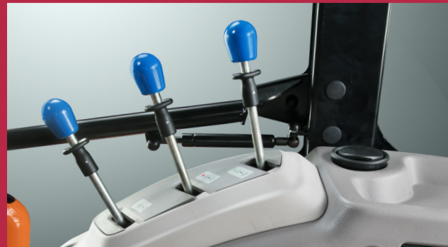
Komfortable Steuerung dank ergonomischer Anordnung der Bedienhebel der Zusatzsteuergeräte.